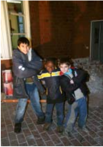
Kinder der Kita „Kinder-glück“ besuchen im Dezember 2005 die Baustelle.

im ersten Stock im Inneren des Gebäudes eine Sporthalle. Hier kann sowohl Basketball als auch Fußball gespielt werden, weitere Hallensportarten sind möglich. Es ist absehbar, dass die Halle sehr intensiv genutzt werden wird. Das Konzept sieht vor, die zur Verfügung stehenden Hallenzeiten in einem angemessenen Verhältnis für hauseigene aber auch fremde stadtteilbezogene Aktivitäten zur Verfügung zu stellen. Zusätzlich kann ein großer Gruppenraum ge-