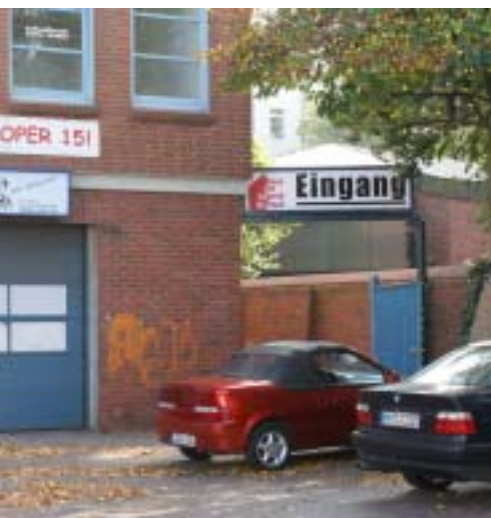
der Familie“: Bei der Schilleroper 15.

zungen für das nun vorliegende Gesamtprojekt geschaffen. Das Jugend- und Sozialdezernat Hamburg-Mitte hatte nach einer Ausschreibung der Dachträgerschaft zwischenzeitlich den Verein SME - Stadtteilbezogene, Milieunahe Erziehungshilfen e. V. aus der Margaretenstraße beauftragt, das Helmut-Hübener-Haus zu einem zeitgemäßen „Haus der Familie“ wei-