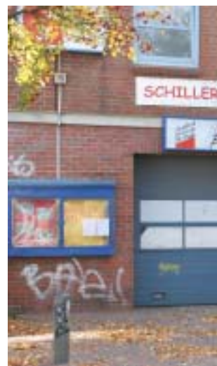
Vom Jugendzentrum zum „Haus der Familie“

In einem relativ engen Zeitraum von der ersten Projektidee an haben das Jugend- und Sozialdezernat Hamburg-Mitte und die Behörde für Stadtentwicklung und Umwelt gemeinsam mit der steg in engem Dialog mit den künftigen Projektträgern die Vorausset-