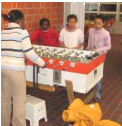
Gelungen: Das neue „Haus der Familie“.

Ab 15 Uhr tritt im Saal eine Samba-Kinderband auf. „Kinder-glück“ bietet ein buntes Spieleprogramm an. In der Sporthalle kann man Fußball spielen, im Medienraum zeigt KIZ, wie man Fotos und Grafiken am PC bearbeitet. Eine Stunde später sorgen die St. Pauli-rock´n´roll-kids im Saal für Stimmung, Daglara ezgi spielen